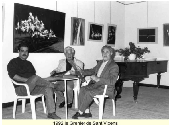
1992 le Grenier de Sant Vicens