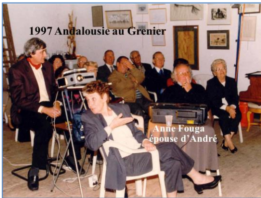
de l'exposition des tableaux de Bausil